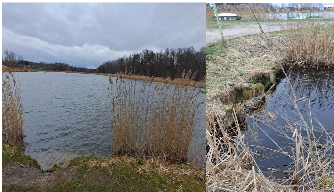
Zbiornik nr 4