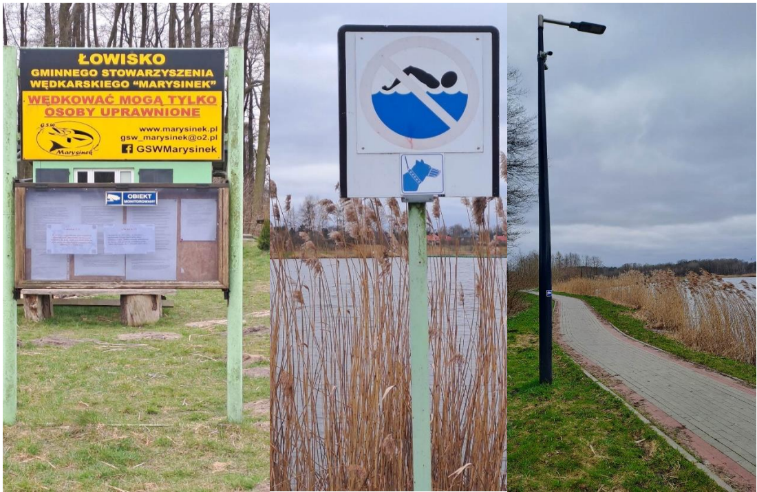
Zbiornik nr 2