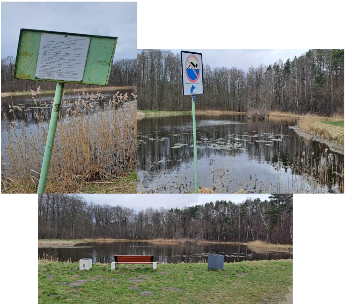
Zbiornik nr 3