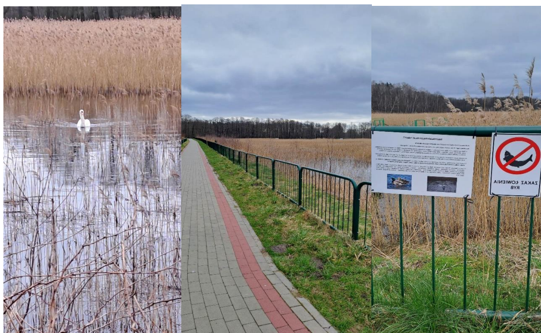
Zbiornik nr 1